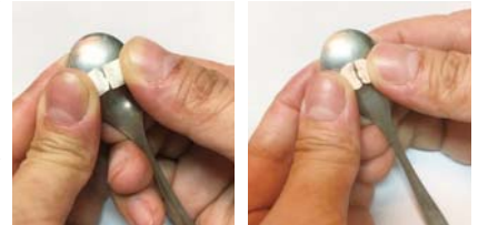
雙手拇指盡量平均的輕壓藥品，接著左右拇指同時均勻的向下施力，藥品剝半就輕鬆完成了。