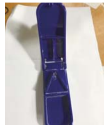
▲市售常見的切藥器

在這裡，藥師有好康報你知。日常生活中，偶爾會愜意地來杯咖啡，不管是加糖美式或是奶香濃郁的拿鐵，往往會拿起優雅的攪拌匙，將糖或是牛奶拌勻。就是這支「咖啡攪拌匙」！它是藥品剝半的好幫手。無論藥品是何種形狀、大小，只要用攪拌匙就可以輕鬆搞定，再也不用怕被切藥器切碎成好幾塊。